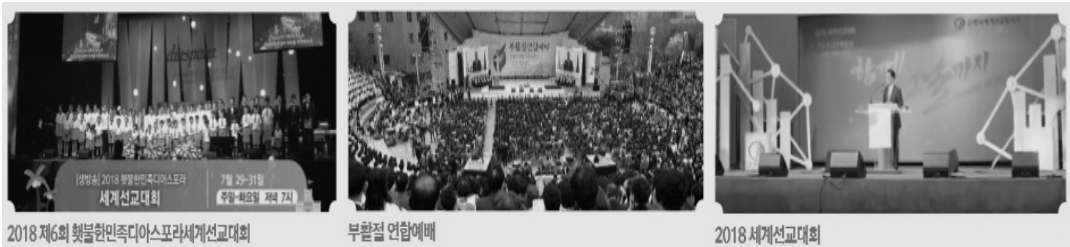
2018 제6회 햇불한민족디아스포라세계선교대회